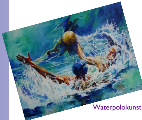
Waterpolokunst; Schilderij van Angelique van den Born - Sportart

"If water polo was easy ... It was called football"